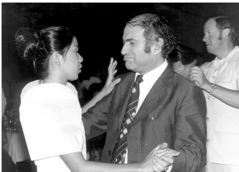
Белый танец в Багио.