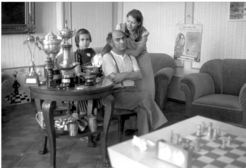
Семейный портрет в интерьере.